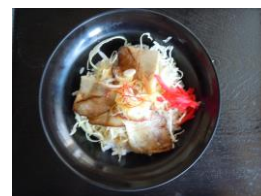
C. ミニチャーシュー丼