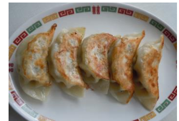
やまざきポーク餃子