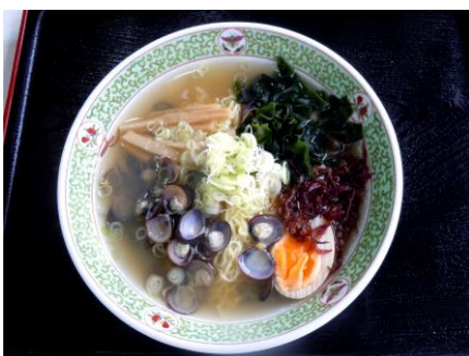
しじみラーメン (寺山修司ラーメン)