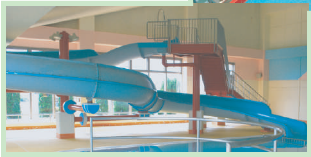
【ウォータースライダー】 ◇ 全長 31.6m