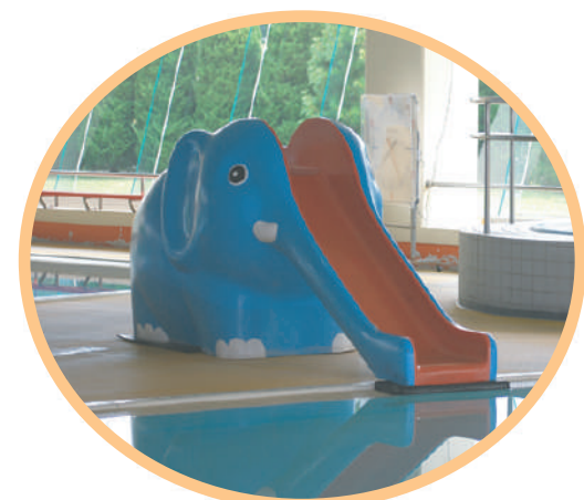
ゾウさんの滑り台