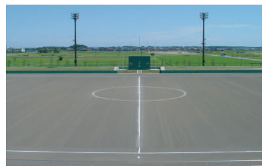
◇130m × 90m (クレイ舗装)