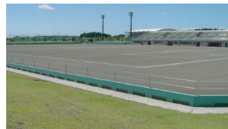
◇観客席 804席 芝生 3, 500人