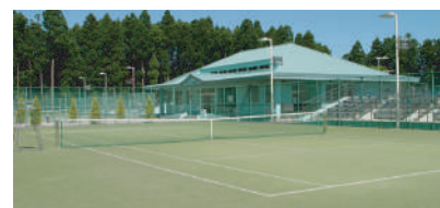
◇オムニコート7面 ◇観客席 1, 024席